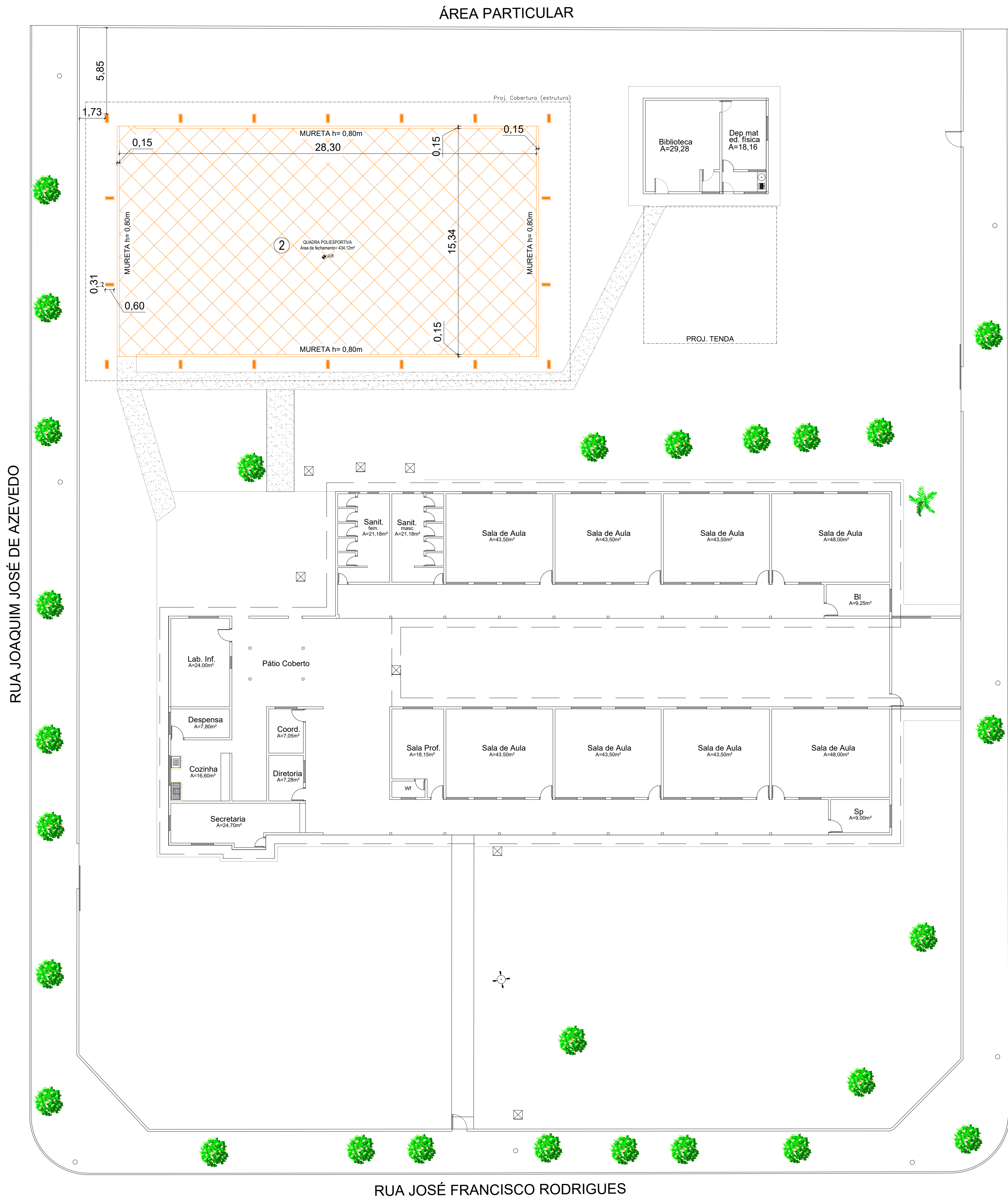
PLANTA BAIXA - DEMOLIÇÃO ESCALA: 1/100